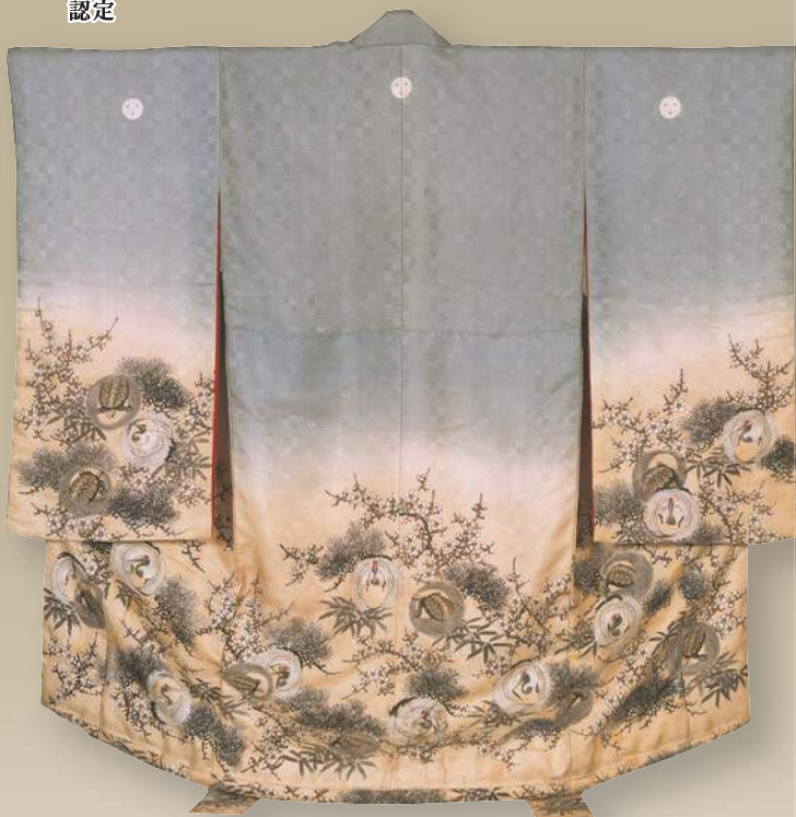
かめあやおりさぬじつのかめ しょうちくばいふくじゆもようあい すみ ペにあけほのぞめおんちゆうだちいひぎ 亀綾織絹地鶴亀に松竹梅福寿模様藍に墨と紅曙染女中裁祝着