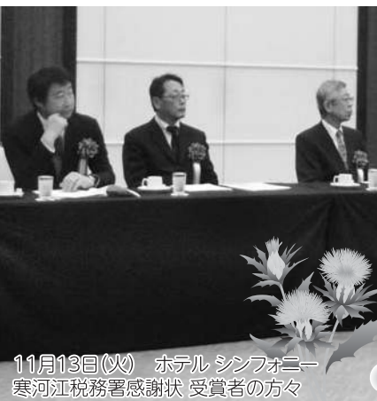
11月13日(火) ホテル シンフォニー 寒河江税務署感謝状 受賞者の方々