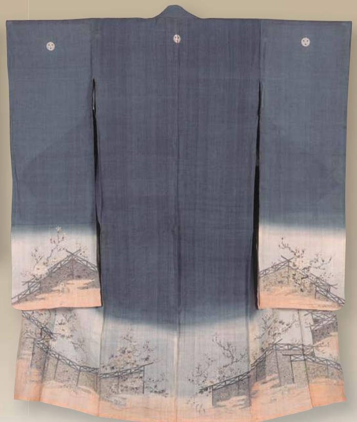
ようりゅうじょうふじまがき はるはなもようあいずみ ペにあけほのぞめひとえおおふりそで 楊柳上布地籬に春花模様藍墨と紅の曙染単衣大振袖